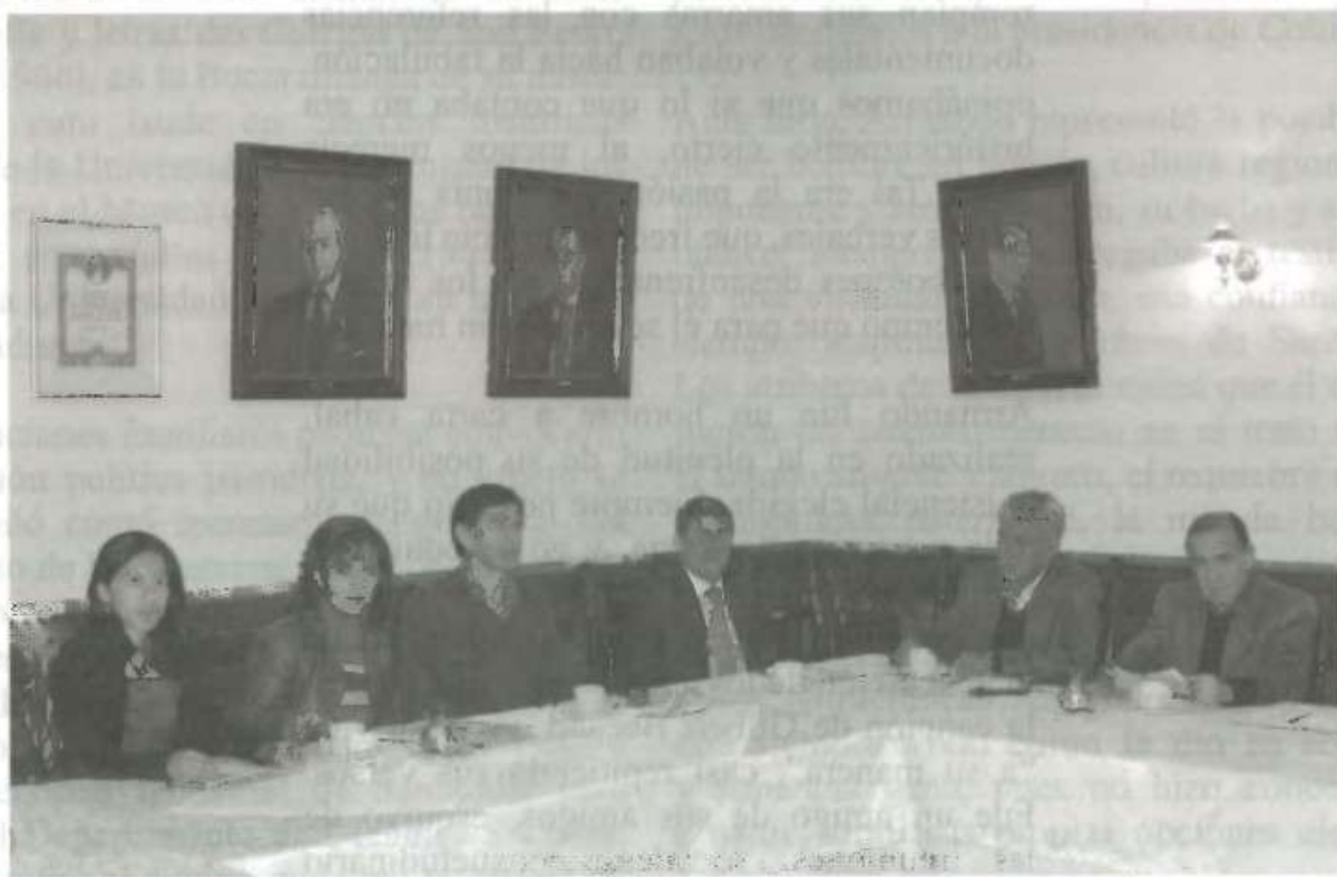
Reunión de la Junta Directiva de la Asociación Colombiana de Historiadores en la Universidad del Rosario.