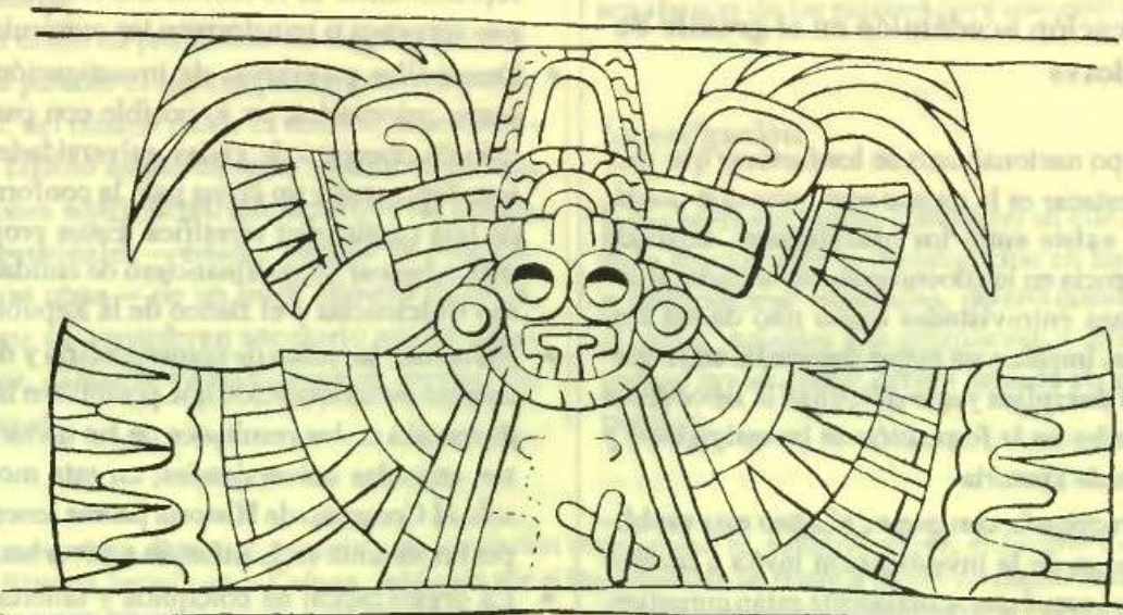
Dios de la Lluvia pintado al fresco sobre un vaso teotihuacano.

Crear una red de intercambio de publicaciones y un banco de datos de tesis cuyo objeto de estudio sea la Historia. Esta es una tarea que posiblemente debería asumir la Asociación Colombiana de Historiadores.